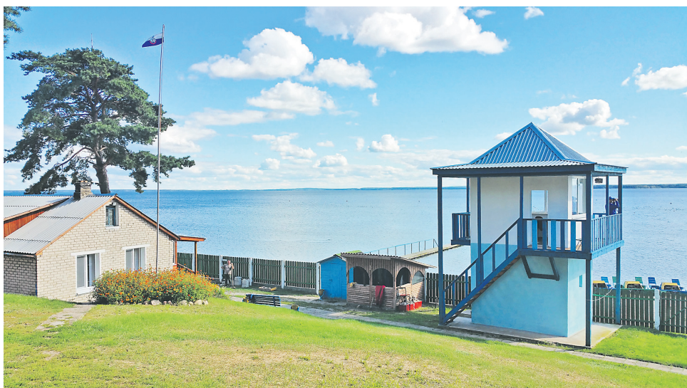
С наблюдательной вышки спасательной станции на озере Нарочь видно далеко

Минская областная организация ОСВОД 220030 г. Минск, ул. Комсомольская, 13 Тел./ факс: 8 (017) 226-06-08 – приемная, 226-05-94 – бухгалтерия, 226-16-14 – водолазно-спасательная служба E-mail: osvov.bux@yandex.by michailfrolov59@mail.ru