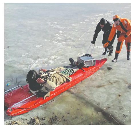
Спасение рыбака на озере Нарочь сотрудниками ОСВОД и МЧС. Человек проигнорировал предупреждения об опасности и провалился в воду