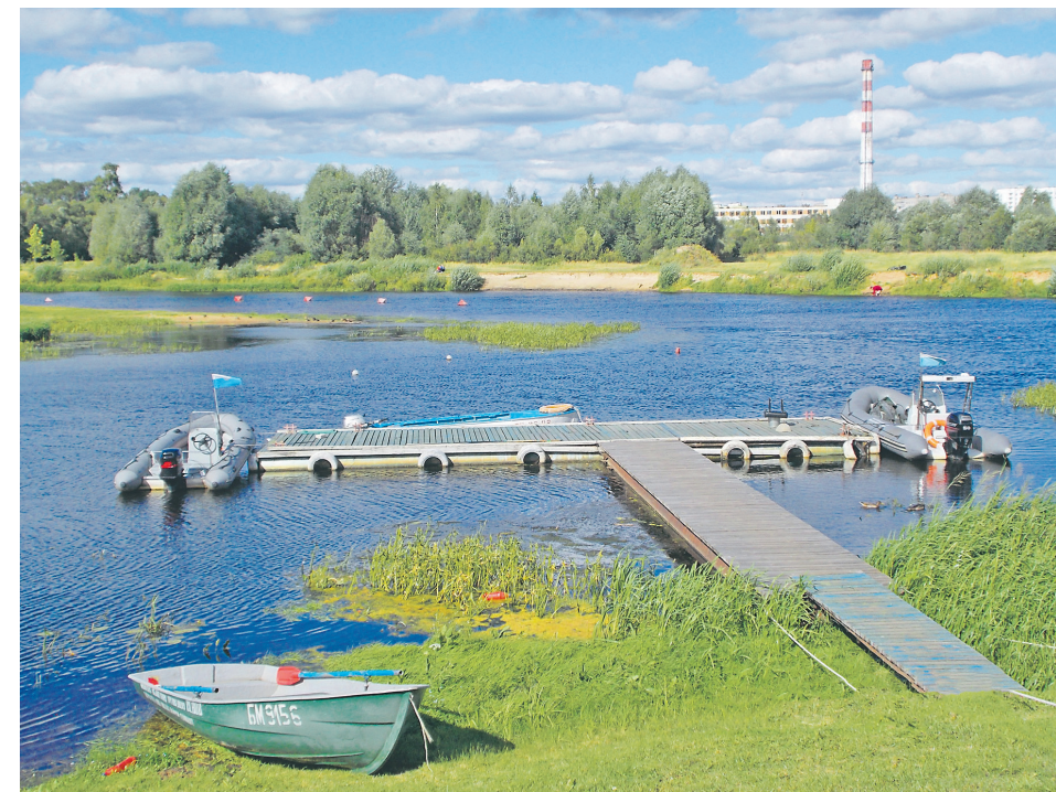
На причале Борисовской спасательной станции с началом купального сезона всегда пришвартованы два катера, оборудованные всем необходимым