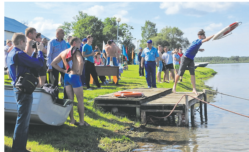
Соревнования по многоборью между спасательными станциями Минского ОСВОД